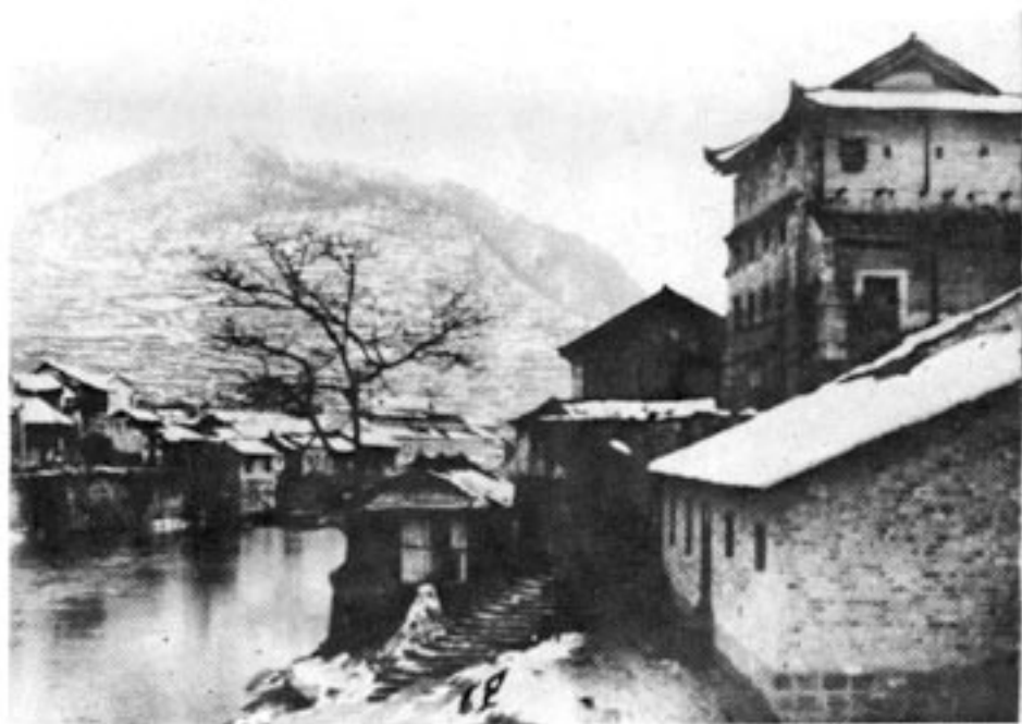
沈从文故乡凤凰古城