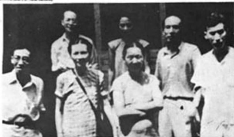
沈从文与梁思成(前排左一)、林徽音(前排左二) 杨振声(右二)合影