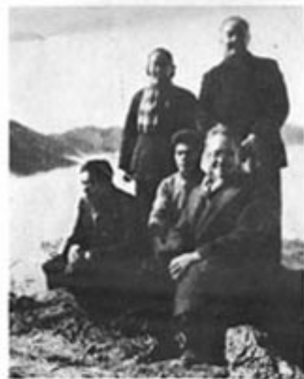
1960年沈从文在井冈山