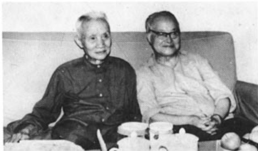
沈从文、朱光潜第四次文代会期间