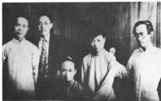
沈从文与他母亲（中）、大哥岳霖（右一） 弟弟岳荃（左二）、九妹（右二）合影