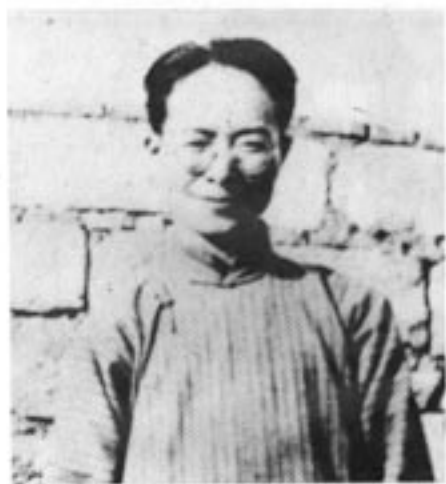
1939年 沈从文 在昆明