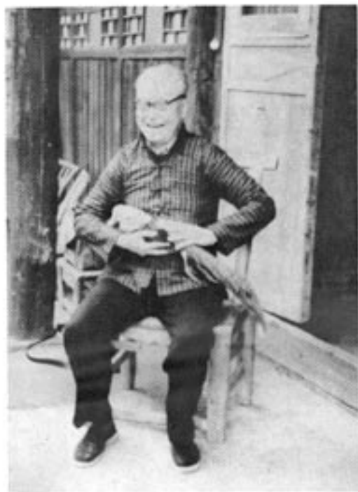
1982年沈从文重返湘西时留影