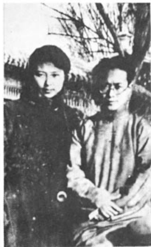
沈从文与夫人张兆和于1934年