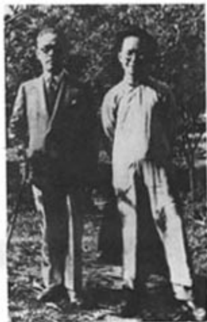
沈从文与张英若抗战时期 在昆明合影