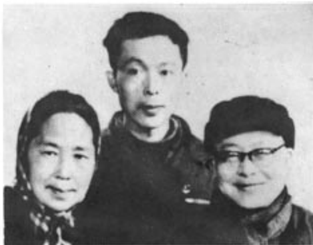
1971年虎雄去丹江探望父母时留影