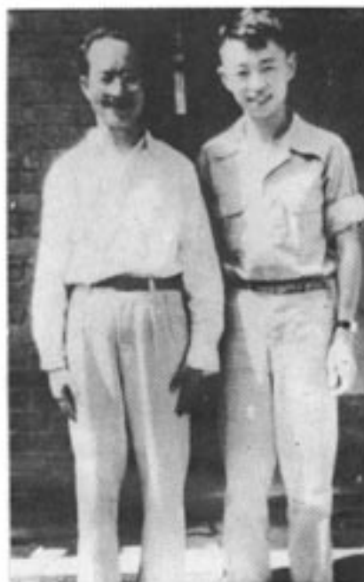
1950年黄永玉从香港来 北京与表叔沈从文合影